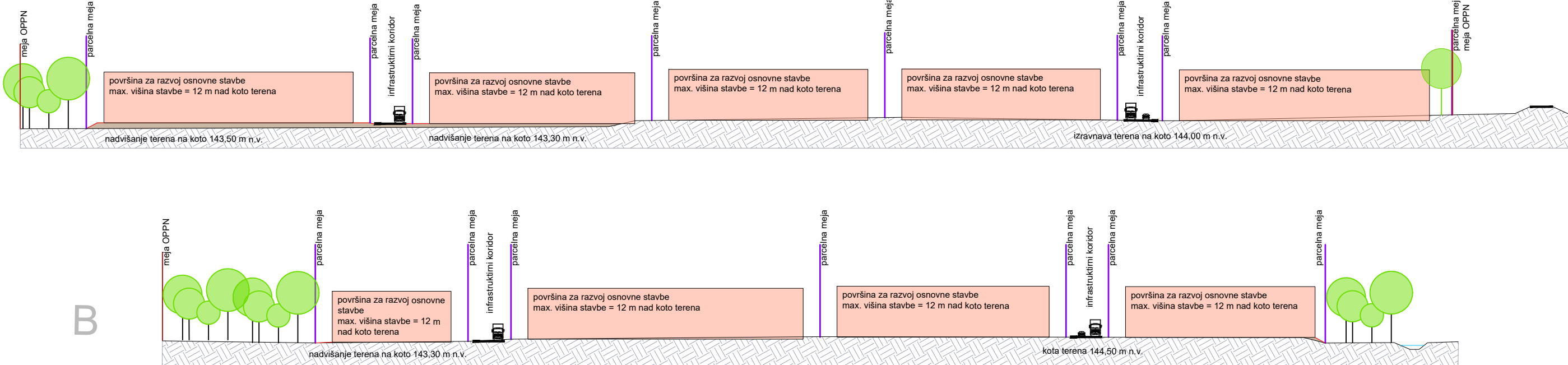
PREČNI PREREZI OBMOČJA "Z"

Občina Brežice Cesta prvih borcev 18 8250 Brežice naznailnik: Občina Brežice Cesta prvih borcev 18 8250 Brežice izvedilnik: Savoprojekt, d.d., Cesta krških žrtev 59, 8270 Krško notrilevnik: Savoprojekt, d.d., Cesta krških žrtev 59, 8270 Krško